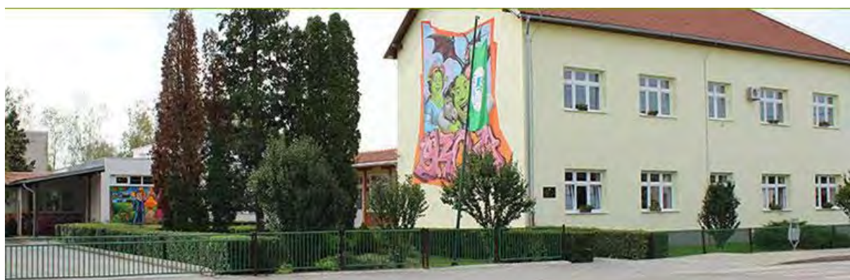
Slika 5: Osnovna škola Velika Ludina

Općina Velika Ludina osigurava sredstva za potrebe provedbe Program javnih potreba iznad standarda u osnovnom školstvu. Program se provodi putem sljedećih aktivnosti: sufinanciranje školske kuhinje, pomoćnici u nastavi te ostale tekuće donacije.