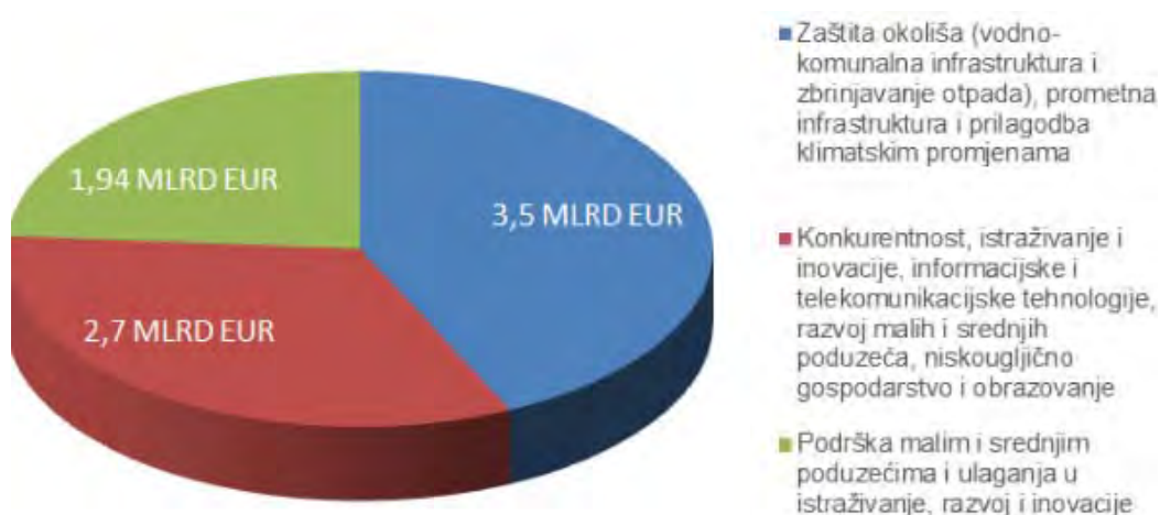
Grafikon 3: Raspodjela po područjima financiranja