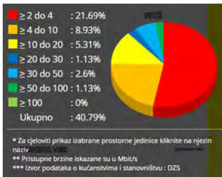
Grafikon 1: Udio pokrivenosti općine Velika Ludina širokopojasnom mrežom prema brzinama prijenosa podataka