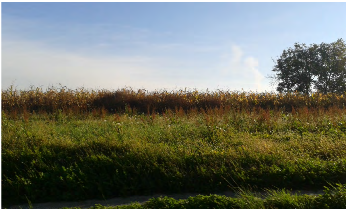
Autor: SI-MO-RA, 2016.

Među mjerama zaštite navodi se gospodarenje travnjacima putem ispaše i režimom košnje, prilagođenim stanišnom tipu, uz prihvatljivo korištenje sredstava za zaštitu bilja i mineralnih gnojiva; očuvanje biološke vrste značajne za stanišni tip; ne unositi strane (alohtone) vrste i genetski modificirane organizme; očuvati povoljni omjer između travnjaka i šikare, uključujući i sprječavanje procesa sukcesije (sprječavanje zaraštavanja travnjaka i cretova i dr.) te na taj način osigurati mozaičnost staništa; očuvati povoljnu nisku razinu vrijednosti mineralnih tvari u tlima suhih i vlažnih travnjaka.