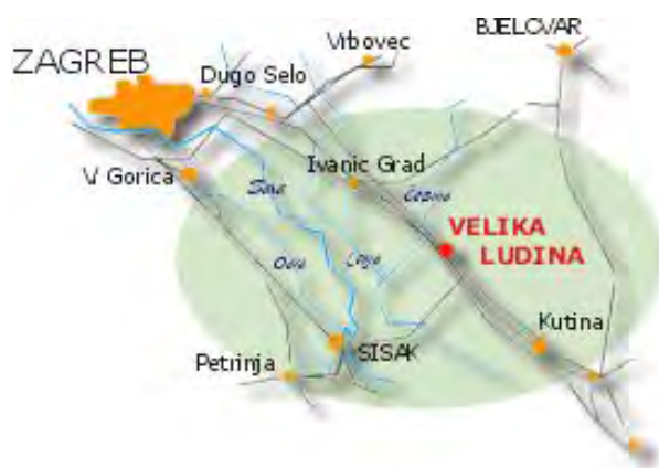
Slika 2: Geografski položaj općine Velika Ludina