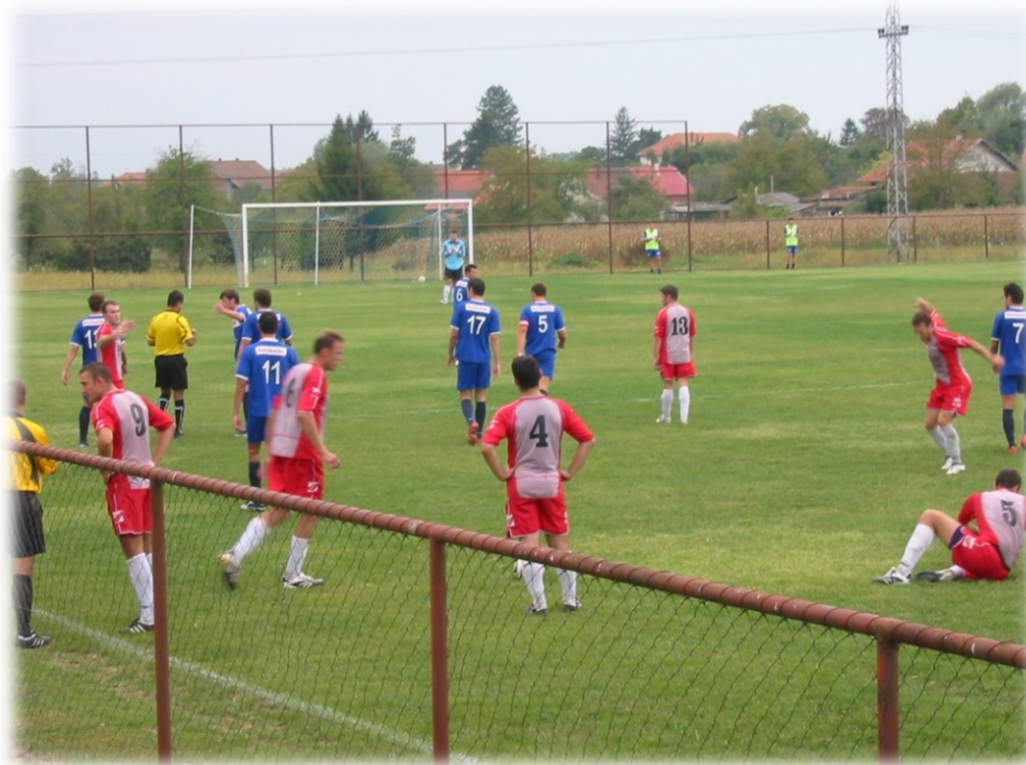
Slika 1. Nogometno igralište Tratinčica